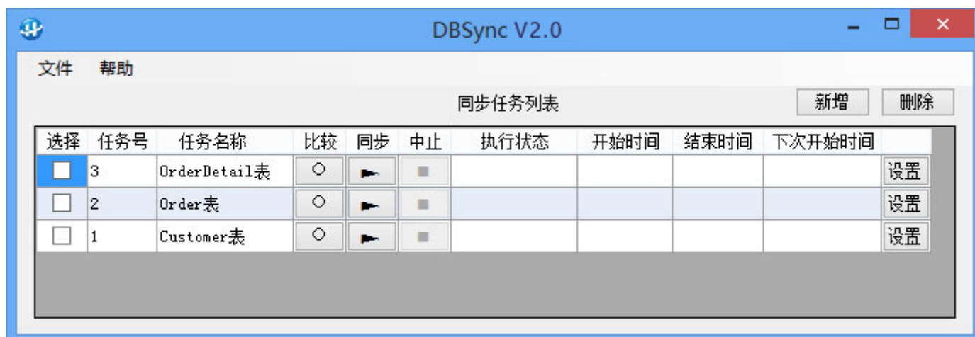
图 2: DBSync 主界面

说明: DBSync 以表为单位进行同步, 一个任务负责一对数据表之间的同步, 要同步多个表就要设置多个任务, 任务可并发执行。主界面的功能介绍如下: