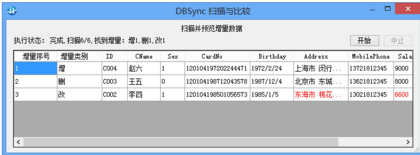
图 7：扫描与比较双方数据

设置好同步任务后，Click 任务列表中的“○”按钮，进入扫描与比较界面，如下图所示：